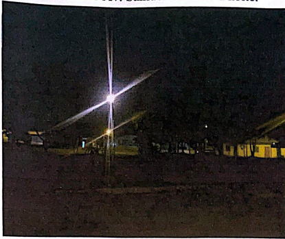
Figura 1 – Imagem Referido Trevo está localizada no centro entre a Tv. Natan Pereira, Rua rio Verde e Av. Samuel Cardoso a noite.